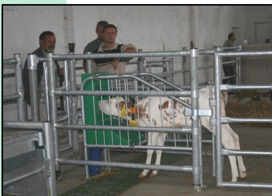
Projekt: Rekonstrukce stáje pro telata Žadatel: AGRO PERTOLTICE, a.s. Celkové náklady: 1.796.900,- Kč Dotace: 607.500,- Kč