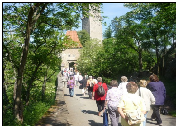
Aktivizační programy pro seniory Občanské sdružení Život 90