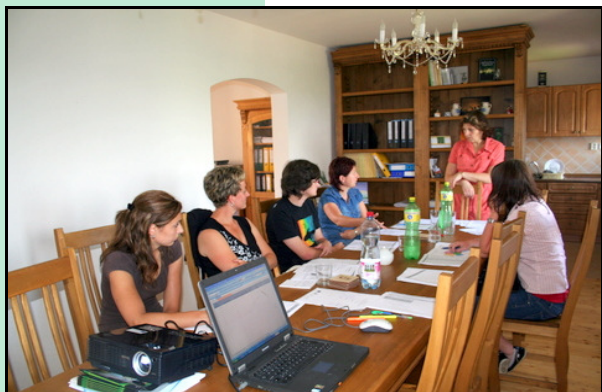
Školení tazatelů k projektu Venkovská tržnice II