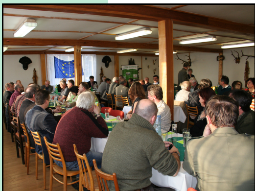
Valná hromada Zbraslavice