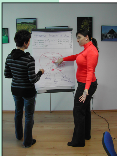
Venkovská tržnice II