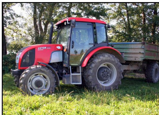
Projekt: Nákup traktoru Žadatel: Městské lesy a rybníky Kutná Hora s.r.o. Celkové náklady: 852.754,- Kč Dotace: 358.300,- Kč