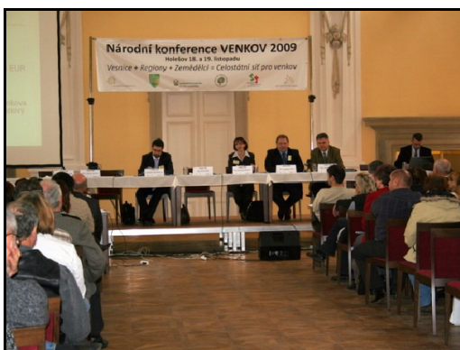
Národní konference „Venkov 2009“ v Holešově