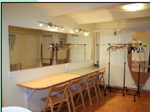
Projekt: Rekonstrukce zázemí sokolovny v Paběnicích Žadatel: TJ SOKOL Paběnice Celkové náklady: 250.000,- Kč Dotace: 198.696,- Kč